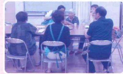
七隈校区家族介護者の集いのようす