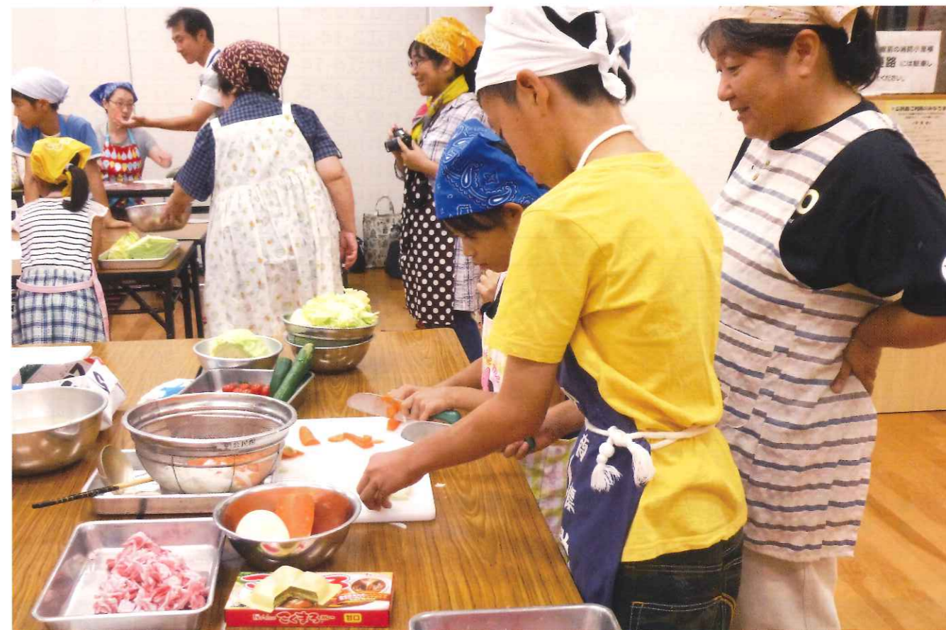
お野菜、うまく切れたかな?

七隈校区に子ども食堂「ななっこ料理道場」がオープンしました。ここでは、月1回、10時～12時に七隈公民館で、子ども達が地域のボランティアに見守られながら、自分で料理を作って皆と一緒に食べています。